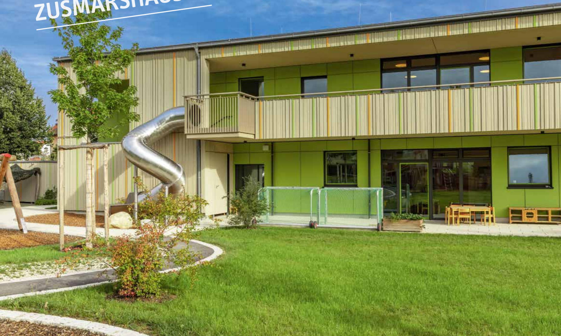
▲ Senkrechte, hellbraune 3D-Holzprofile dominieren die Außenhülle der Zusmarshausener Kita auch zum Spielplatz nach hinten